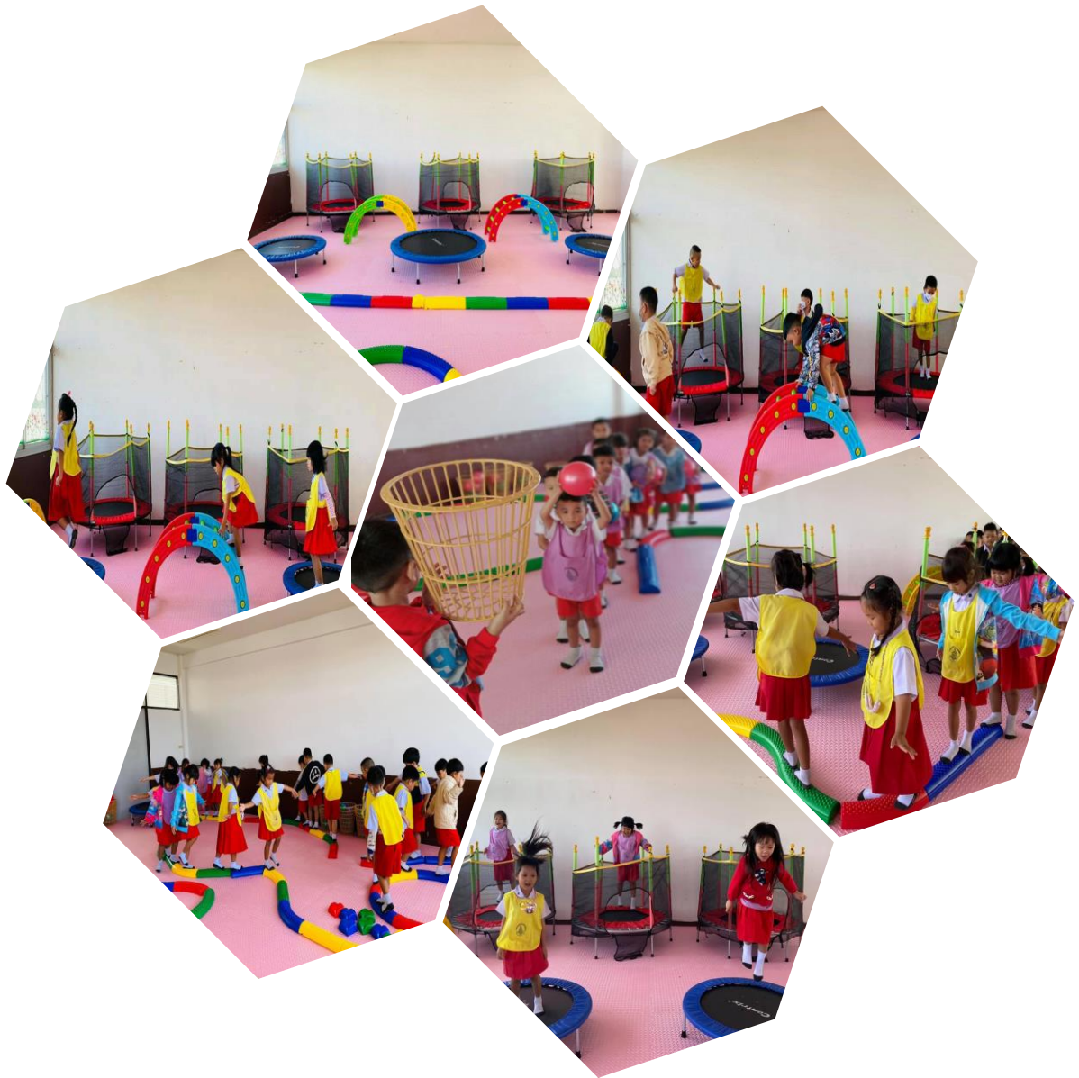
ห้องเรียนยิมนาสติก (Gymnastics Room)