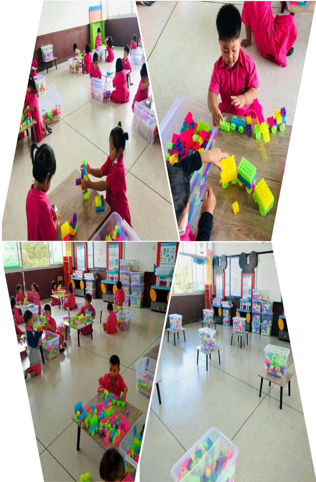
ห้องส่งเสริมความคิดสร้างสรรค์ (Creative Room)