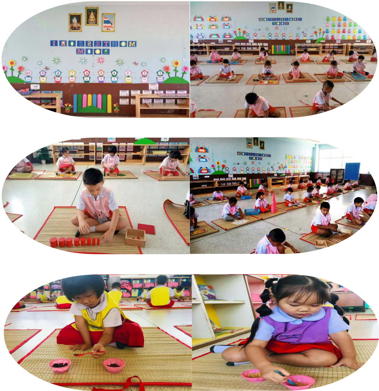
ห้องเรียนรูปแบบการเรียนมอนเตสซอรี (Montessori Room)